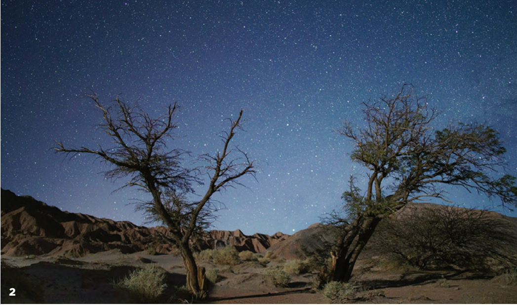
1. Sur la lune de nickel