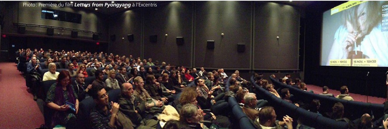
Photo : Première du film Letters from Pyongyang à l'Excentris

les salles de cinéma. Obligés de se démarquer dans un océan de festivals devenus aussi concurrentiels que complémentaires, les organisateurs des plus fréquentés d'entre eux, les RVCQ, Fantasia, FNC et RIDM, n'ont eu d'autre choix que de rajeunir leur image de marque en optant pour un « spectacle » diversifié qui va bien au-delà du simple mandat de présenter des films. Un tournant marketing que n'a jamais réussi le FFM d'ailleurs, engoncé de plus dans une programmation pas toujours à la hauteur.