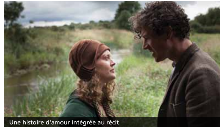
Une histoire d'amour intégrée au récit