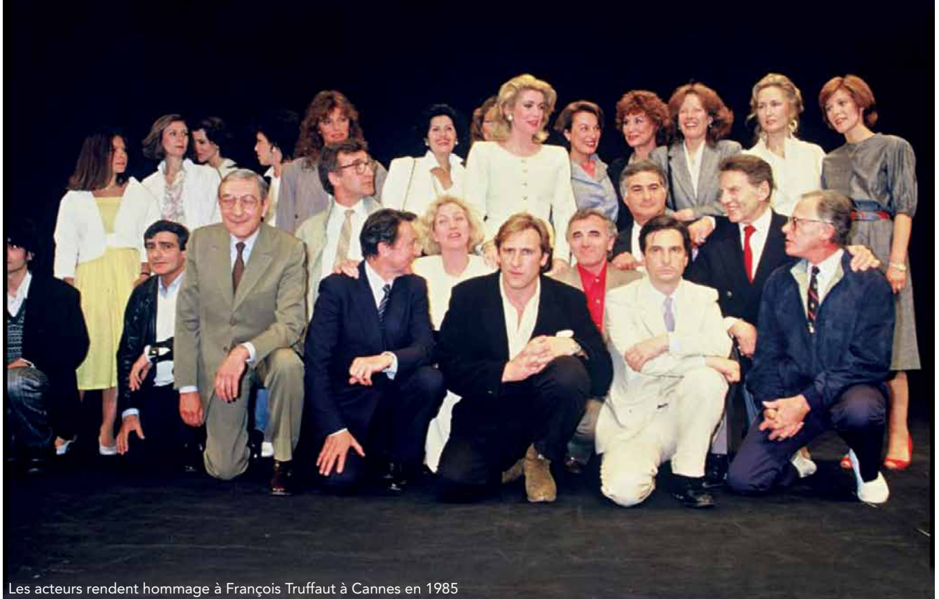
Les acteurs rendent hommage à François Truffaut à Cannes en 1985

«Je tenais mordicus à ces deux fameuses lettres, horribles, où ils s'étaient jeté leurs quatre vérités à la figure. L'un disait "Tu es un menteur", l'autre: "Tu es un salaud". Leur violence était d'autant plus grande méchanceté qu'ils se connaissaient intimement!»