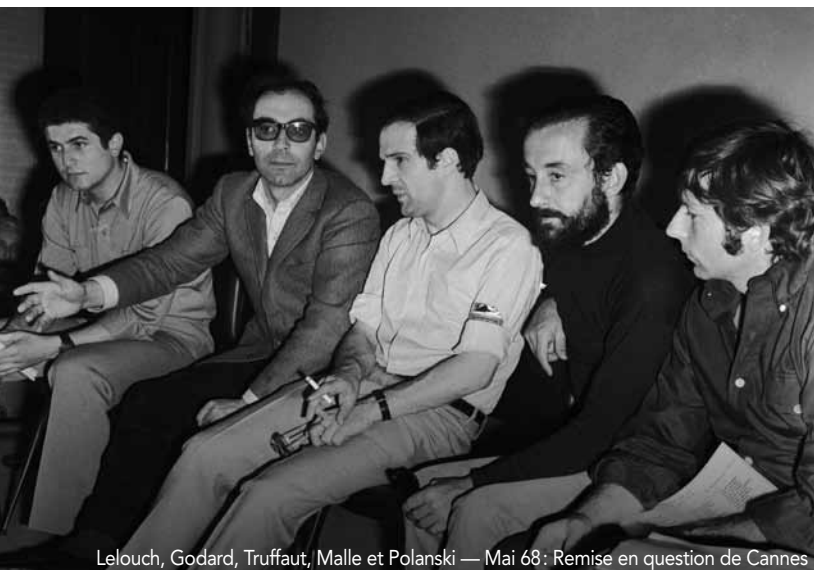
Lelouch, Godard, Truffaut, Malle et Polanski — Mai 68: Remise en question de Cannes