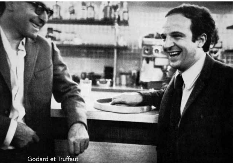
Godard et Truffaut