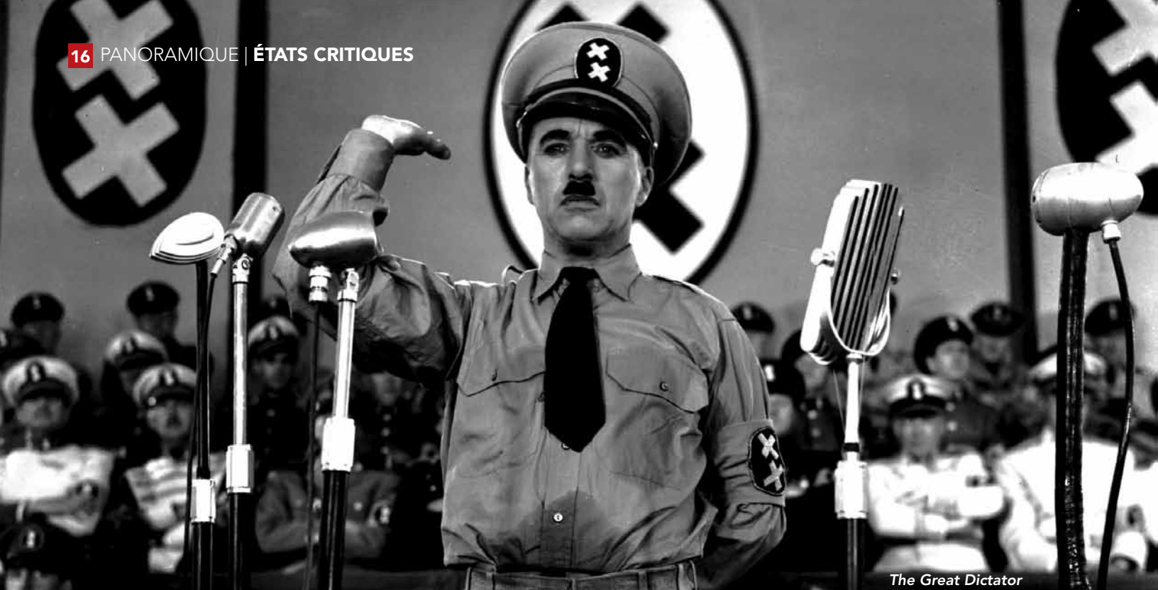
The Great Dictator

opinion du film, pas dans une mesure drastique. Souvent, ce qui peut changer, c'est mon interprétation du film. Il se peut qu'en cours de visionnement j'omette des éléments du discours ou de la mise en scène. Par exemple, il va arriver qu'un collègue me fasse remarquer une scène ou un plan que j'aurais négligés; du coup, notre échange risque de modifier ma manière de réfléchir sur le film.