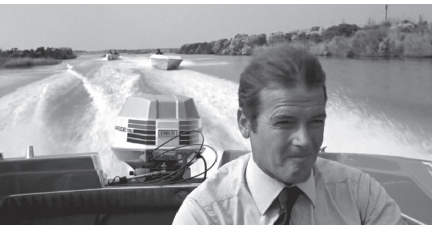
Une opération de sauvetage

Il reviendra la libérer une seconde fois de l'ultime sacrifice, alors que Kananga la vouait à une mort certaine par la piqure d'un serpent venimeux ( Sacrifice ), avant de convoler avec elle dans un compartiment de première classe dans une scène qui n'est pas sans rappeler au cinéophile la finale de North by Northwest ( La Mort aux trousses , 1959) d'Alfred Hitchcock. Il existe aussi un quatrième thème – pas banal du tout, celui d'un suspense –, celui de Bond à New York et celui de la Nouvelle-Orléans. Tout le monde connaît la vieille formule selon laquelle on ne peut jamais tirer un bon film d'un mauvais scénario, mais nous pourrions aussi affirmer que l'on ne peut jamais tirer un mauvais film d'une excellente trame sonore. Il arrive parfois que la trame sonore soit nettement supérieure au film comme dans Sacco et Vanzetti (1970) de Giuliano Montaldo. Il s'agit de cas d'espèce rarissimes, mais pas impossibles. La partition de George Martin en offre un cas exemplaire et magistral. Lorsque cela se produit, le film est tout simplement magnifié pour la postérité... ⑨