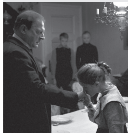
Le Ruban blanc