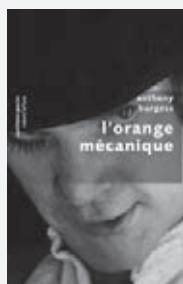
Anthony Burgess L'Orange mécanique ; traduit par Georges Belmont (Pavillons Poche) Paris: Les Éditions Robert Laffont, 2011 322 pages