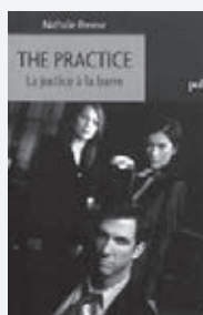
Nathalie Perreur The Practice: La justice à la barre (Hors collection) Paris: Presses Universitaires de France, 2012 144 pages