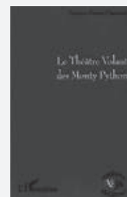
Simon-Pierre Castanié Le Théâtre volant des Monty Python (Univers théâtral) Paris: L'Harmattan, 2011 156 pages