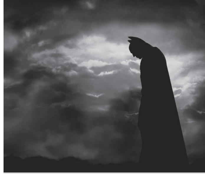
Batman Begins | Exit l'optimisme et la bravoure naïve