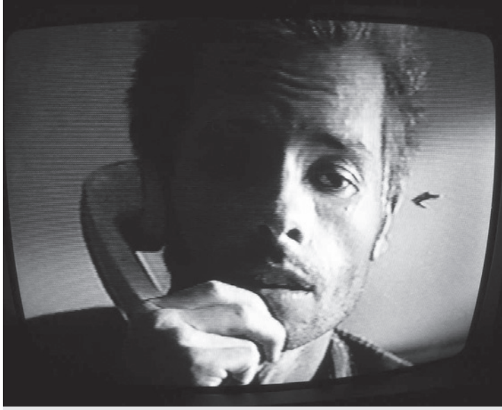
Memento | Un puzzle inversé