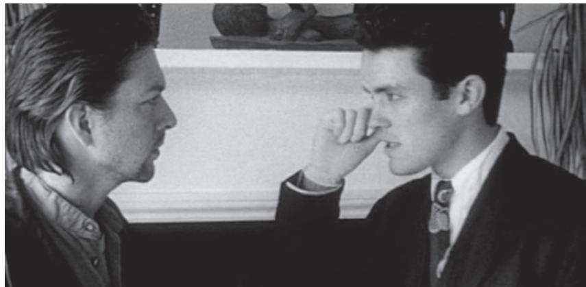
The Following | La crainte instinctive d'être suivi

Dès ses premières œuvres, Christopher Nolan montre de l'intérêt pour les situations angoissantes. À Londres où il est né, il réalise à 27 ans le remarqué court-métrage en noir et blanc de trois minutes Doodlebug . On y voit un jeune homme enfermé dans une petite pièce sombre et armé d'une chaussure. Il tente ainsi d'attraper sans grand succès une sorte de créature minuscule. On se rend compte que cette chose qu'il finit par tuer n'est qu'une réplique de lui-même en miniature. Doodlebug présente déjà le style Nolan qui film la peur en mettant sous pression son personnage. Ambiance claustrophobe, musique lancinante, esthétisme froid et monde déshumanisé, le style du réalisateur impressionne par son savoir-faire.