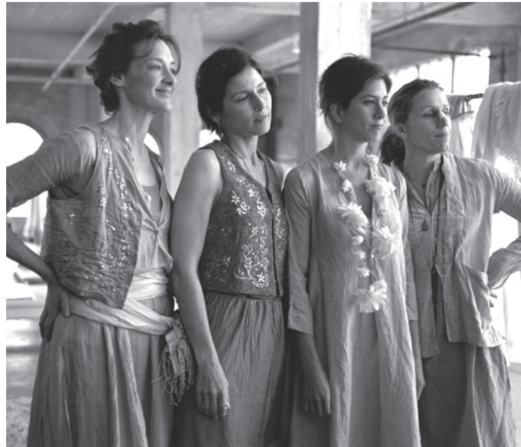
Friends With Money

3. Présence d'un degré d'autonomie entre chaque histoire: Lorsqu'on tente de résumer un film choral, il n'est pas rare de rencontrer certaines embûches. En effet, synthétiser, en tâchant de ne rien omettre de chaque sous-intrigue, est une tâche parfois complexe. Le résumé présent sur la jaquette du film Le Goût des autres (2000) d'Agnès Jaoui illustre très bien l'absence d'intrigue centrale: « C'est l'histoire d'un chef d'entreprise qui rencontre une actrice qui est amie avec une serveuse qui rencontre un garde du corps qui travaille avec un chauffeur qui conduit une décoratrice qui est la femme du chef d'entreprise qui voudrait être ami avec des artistes... »