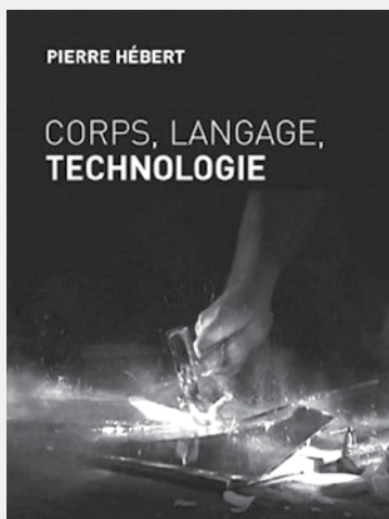
Corps, langage, technologie Pierre Hébert Montréal : Les 400 coups, 2006 212 pages