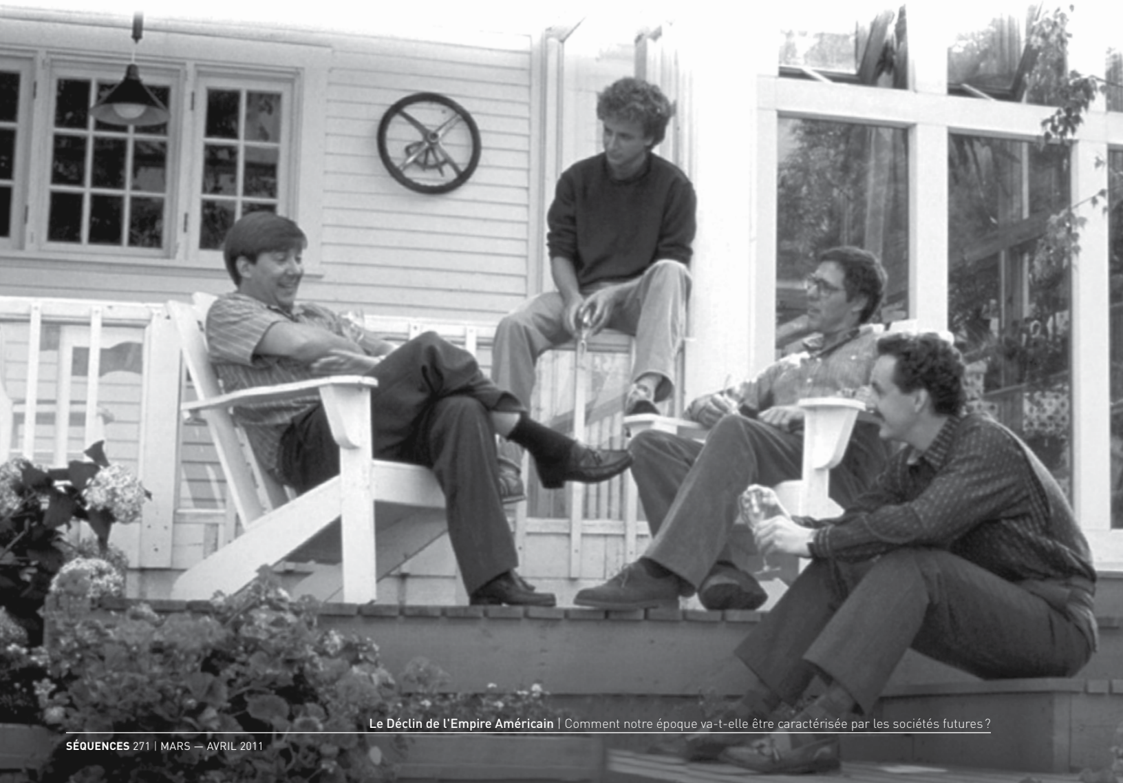
Le Déclin de l'Empire Américain | Comment notre époque va-t-elle être caractérisée par les sociétés futures ?

Ça, c'est fatal. Dans tous les pays, il y a d'étranges correspondances entre les sujets qu'abordent les cinéastes ou les écrivains. Quand j'ai commencé à travailler sur Jésus de Montréal , après Le Déclin de l'empire américain , quelqu'un est venu me voir en disant: «Tu ne peux pas faire ça, je viens d'apprendre que Martin Scorsese va tourner The Last Temptation of Christ la semaine prochaine!» J'ai dit: «Pourquoi je ne le ferais pas? Ça ne change rien.» Il n'était pas question que je change de sujet. Mais, pour revenir à votre citation, Fellini a effectivement fait Le Satyricon , qui portait sur