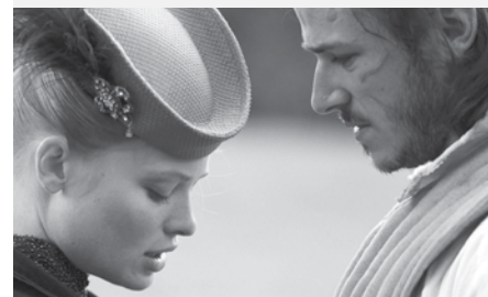
■ France/Allemagne 2010, 139 minutes — Réal. : Bertrand Tavernier — Scén. : Bertrand Tavernier, François-Olivier Rousseau, Jean Cosmos d'après la nouvelle de Madame de La Fayette — Int. : Mélanie Thierry, Lambert Wilson, Grégoire Leprince-Ringuet, Gaspard Ulliel, Raphaël Personnaz — Dist. : Axia.