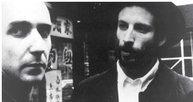
Un noir et blanc qui éradique le gris

U En réalisant Pi , Aronofsky faisait naître son premier long métrage avec très peu de moyens. Sans producteur ni maison à hypothéquer, le jeune cinéaste avait emprunté 100 $ à ses amis et leur avait promis que 150 $ leur reviendraient si la sortie du film pouvait suffire à rembourser ses frais. Aucun d'entre eux ne se doutait bien sûr qu'une œuvre sur l'obsession mathématique — qualifiée de « passionnant devoir d'école » par Positif — encaisserait trois millions de dollars américains et remporterait le prix de la mise en scène à Sundance en 1998. Enfant terrible des studios, Aronofsky multiplie depuis les projets ambitieux et sait enjamber avec adresse les dangers que seuls les grands réalisateurs savent contourner. Ce front et cette ardeur lui ont valu plusieurs critiques acerbes; Aronofsky en est sorti indemne dans tous les cas.