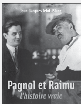
Pagnol et Raimu : L'histoire vraie Jean-Jacques Jelot-Blanc Monaco: Alphée, 2010 295 pages