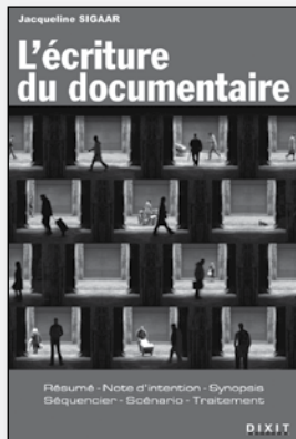
L'écriture du documentaire Jacqueline Sigaar Paris: Dixit, 2010 256 pages