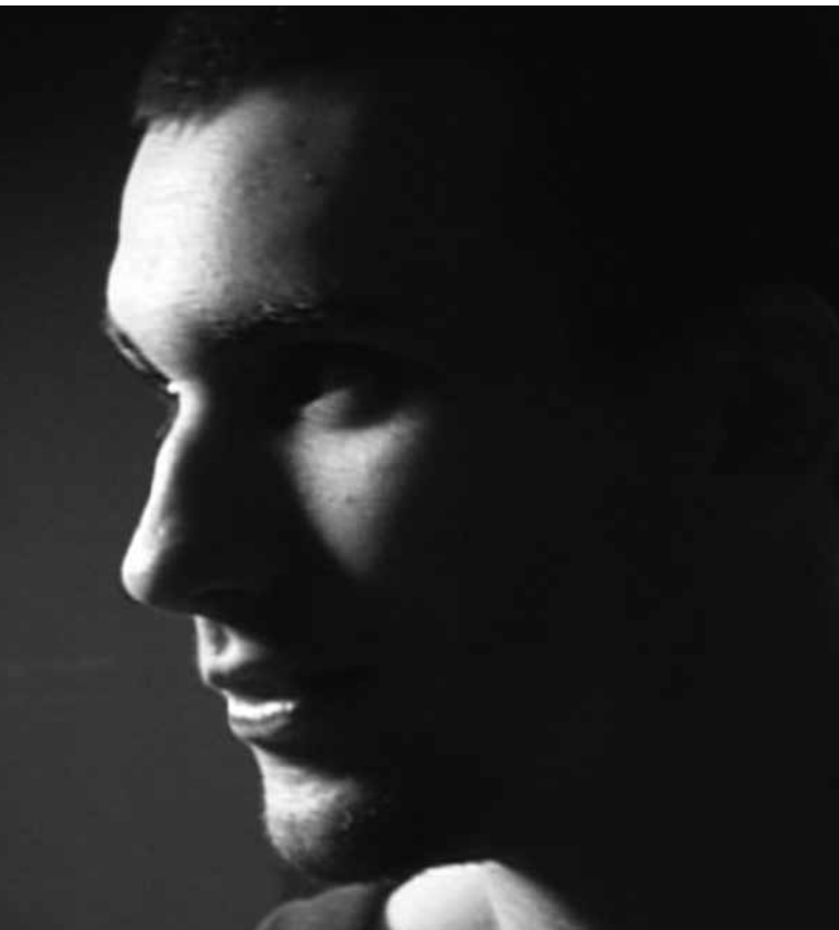
Le gros plan comme dispositif filmique

L'utilisation de la caméra numérique prouve une fois de plus ici toute sa puissance et montre comment ses caractéristiques peuvent être exploitées par les cinéastes. Avoir ainsi suivi ces travailleurs du sexe pendant plus de douze mois avec une caméra 35 mm et une imposante équipe de tournage aurait engendré des coûts considérables. Mais l'enregistrement numérique, peu coûteux, permet de filmer en continuité pendant de longues minutes, voire des heures. N'oublions pas non plus la petitesse de ces caméras, autre élément ayant contribué à ce que les jeunes oublient, au fil des mois, la présence de ladite caméra. On sent rapidement qu'ils sont en confiance devant l'équipe de tournage et qu'ils communiquent le fond de leur pensée, sans peur de représailles ni crainte de jugement. Le passage du temps, cette douzaine de mois au cours desquels