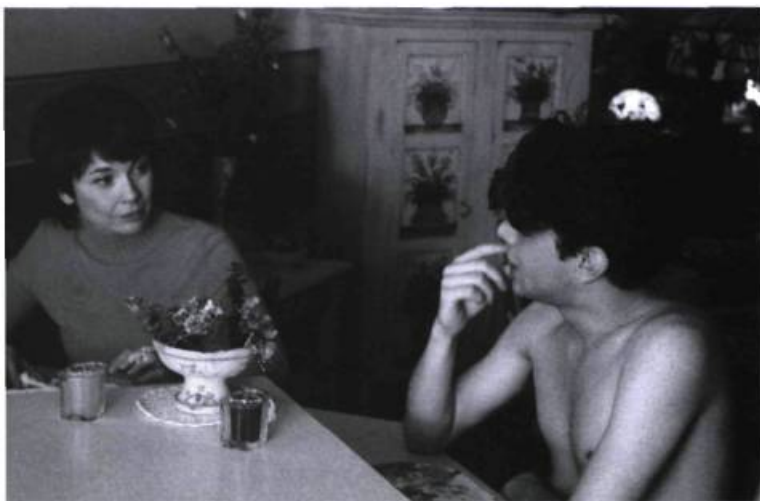
Une fiction agitée, et somme toute assez verbeuse.