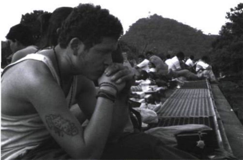
Les valeurs et la souplesse morale des personnages détermine illico leur destinée

Comme plusieurs autres cinéastes latinos de sa génération, à l'instar d'Alex Rivera ( Sleepdealer ), Fukunaga a su tirer profit des nombreux programmes de développement disponibles aux États-Unis à l'égard des réalisateurs des communautés culturelles afro-américains, chicanos, autochtones et asiatiques, comme ceux dispensés par le Sundance Lab, avant de tourner sa caméra vers des enjeux situés à l'extérieur du territoire yankee.