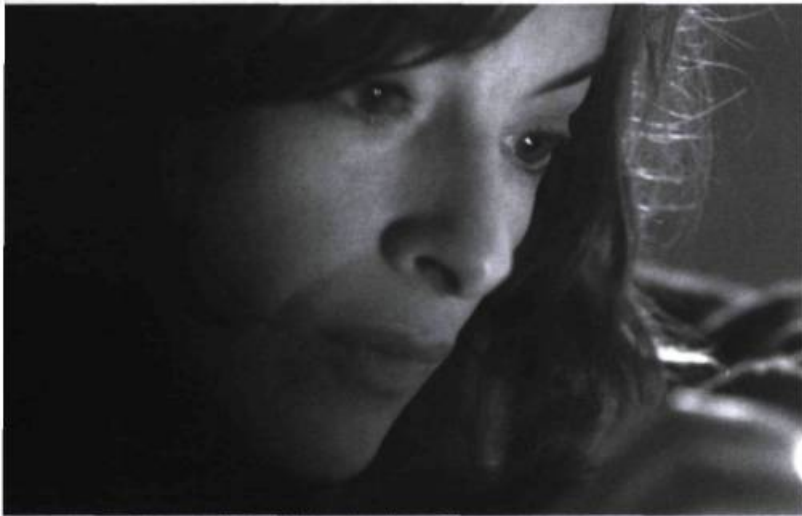
Film sur la solitude et le désarroi en milieu urbain