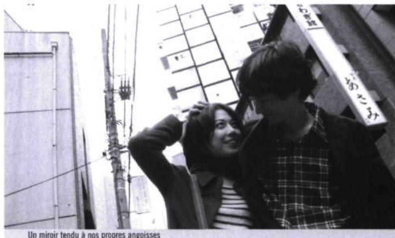
Un miroir tendu à nos propres angoisses

Le dernier opus, on le doit au réalisateur et scénariste coréen Bong Joon-ho ( Memories of Murder , The Host ). Connu internationalement pour ses œuvres noires, on s'attendait avec Shaking Tokyo à être basculé dans un univers angoissant. Le cinéaste a plutôt décidé de s'attarder sur un phénomène véridique et très connu au pays du soleil levant, les hikikomori, ces gens qui ne sortent plus de chez eux. Depuis une dizaine d'années, un homme vit enfermé dans son appartement. S'interdisant autant que possible les contacts sociaux, il se retrouve confronté contre son gré à