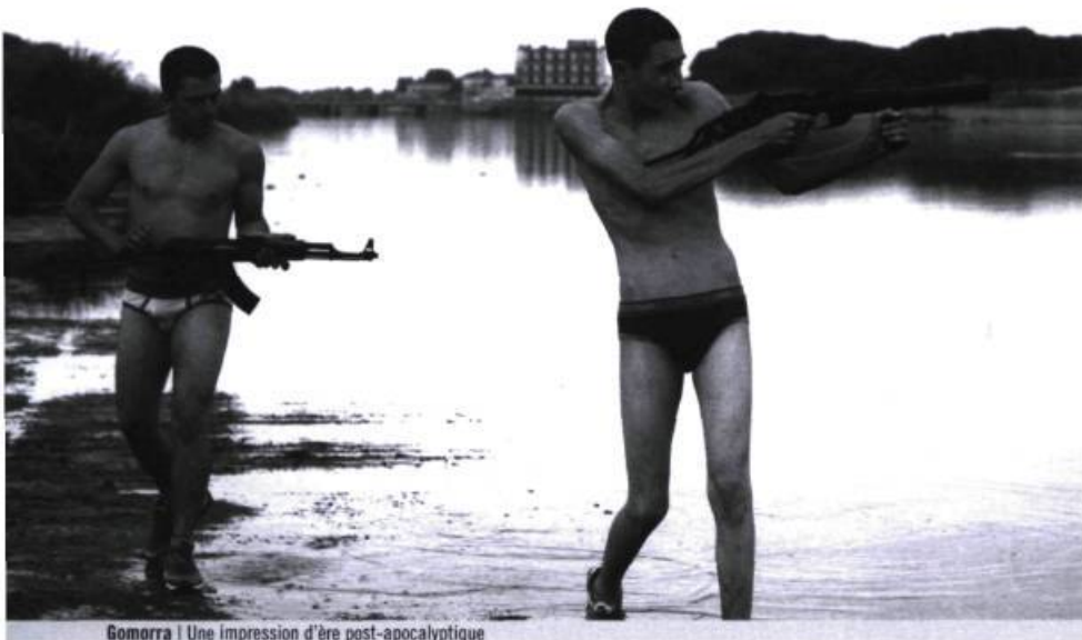
Gomorra | Une impression d'ère post-apocalyptique

Ce qui impressionne lorsqu'on voit coup sur coup Gomorra et Il Divo , sortis presque simultanément sur nos écrans, c'est la force d'une démarche artistique qui semble vouloir aller au-delà des dogmes et qui transcende le discours politique. Les auteurs de ces films, Matteo Garrone et Paolo Sorrentino, échappent aussi aux soupçons de maniérisme ou même d' a priori politique puisque leur approche respective traduit d'abord une volonté de forcer un regard nouveau et, plus encore, de proposer une nouvelle attitude morale ; tout comme les cinéastes du néoréalisme et de la génération 60 ont su réinventer l'écriture filmique à une époque où la société italienne ressentait le besoin de s'interroger sur ce qu'elle était en train de devenir.