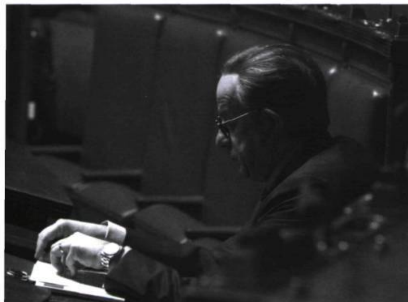
Il Divo | Un personnage à l'allure inquiétante de Nosferatu

En multipliant les espaces intérieurs fermés, les scènes peu éclairées, les dialogues susurrés et une esthétique parfois baroque, le réalisateur a su donner toute la mesure de son point de vue sur le sujet.