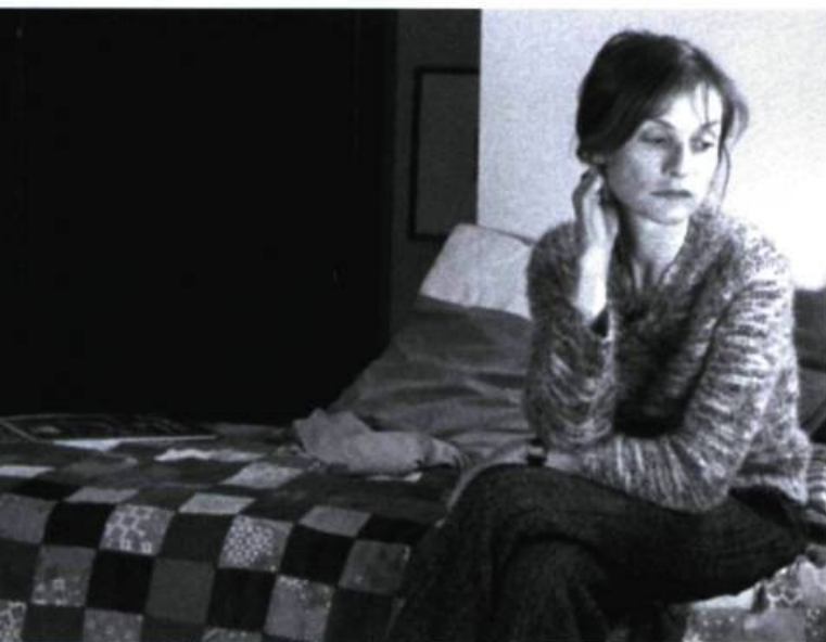
Le constat d'une certaine faillite morale