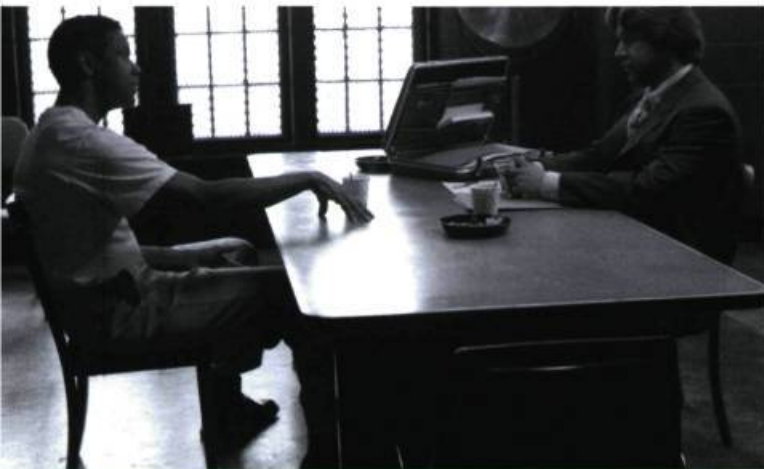
Une œuvre atypique pour des personnages imparfaits

Pour son dernier film, Scott s'aventure encore une fois sur un chemin inconnu : le film de gangsters. Et on peut le dire tout de suite, il s'agit d'un bon Ridley Scott doublé d'un film populaire qui a d'ailleurs cartonné dans les différents box-offices. De fait, tous les ingrédients sont là : Denzel Washington en méchant gangster, Russell Crowe en Serpico des temps modernes, un scénario béton, des scènes d'action et une rencontre au sommet en conclusion. Rien de bien neuf vous direz, mais bon, on ne réinvente pas toujours le cinéma et ce n'est pas à 70 ans que Scott le fera.