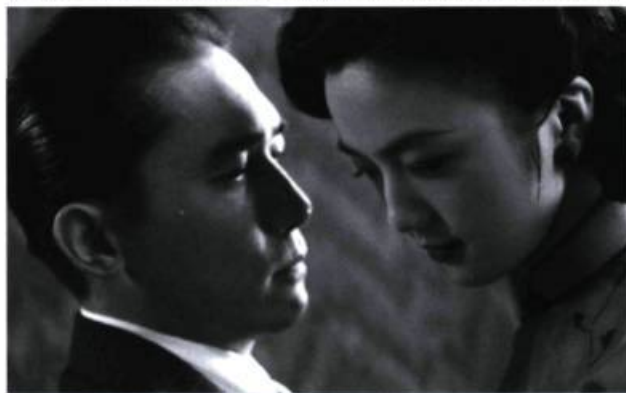
L'assise d'une relation paradoxale

par s'essouffler. Lust, Caution ne joue pas, ou très peu, avec l'anticipation, le suspense et la tension dramatique que suggère pourtant son récit d'infiltration, d'espionnage et de meurtre.