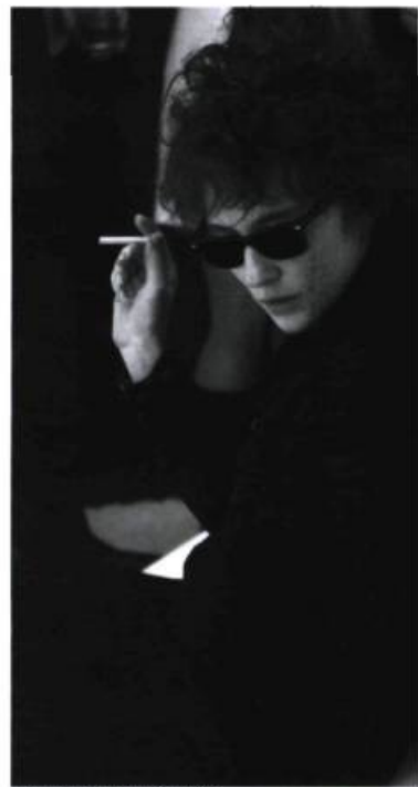
Une aisance époustouflante