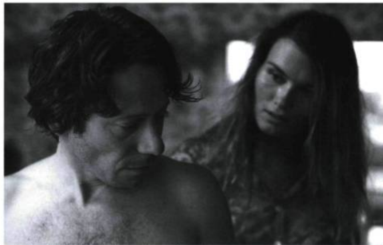
Un patchwork d'images, de rêves, de souvenirs

nous remuent. En 1996, il réalise Basquiat sur la vie mouvementée de l'artiste underground new-yorkais. Un film où il est déjà question de succès, de souffrances et d'une mort tragique. En 2000, il récidive avec Before the Night Falls , film sur l'existence dramatique de l'écrivain cubain Reinaldo Arenas. Une œuvre vibrante, dure et qui ne cesse de nous habiter depuis.