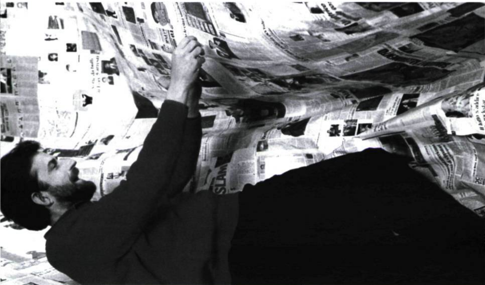
La vie ordinaire s'élève au rang d'œuvre d'art

Par la même occasion, il établit une transition parfaite entre le premier et le second chapitre du film, passant d'une errance à une autre — de Rome aux îles éoliennes, porté par la musique également planante de Keith Jarrett puis de Nicola Piovani. Ce faisant, il nous offre l'une des séquences les plus puissamment évocatrices du cinéma contemporain.