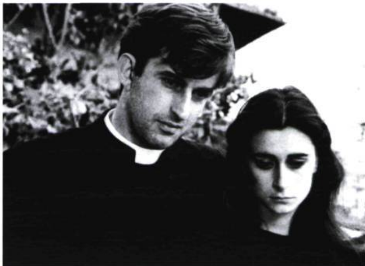
La Messa è finita | Partir / Revenir

À ce propos, on ne compte plus dans les films de Moretti les scènes durant lesquelles Moretti (le personnage, l'acteur... bref, le corps) nous tire vers l'avant, à la rencontre de quelqu'un, de quelque chose. Caro Diario est entièrement construit sur ce principe.