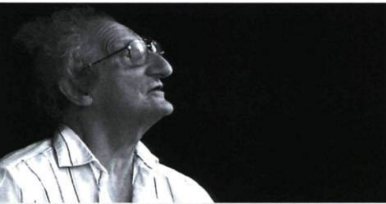
Peintre du vertical, Molinari exprime la dualité du monde

Déjà, le titre est une interrogation directe : Moli qui ? À partir de cette constatation, tout est dans l'espace du possible. Et il y a aussi après le point d'interrogation, un sous-titre révélateur, Molinari l'énigme , sans virgule entre le nom et le qualificatif, évoquant le mystère autour de l'artiste malgré le fait qu'il fut un individu parmi les autres, se rapprochant du citoyen avec toute la simplicité du monde, exigeant certes (ce qui est tout à fait normal), mais lucide envers ses contemporains.