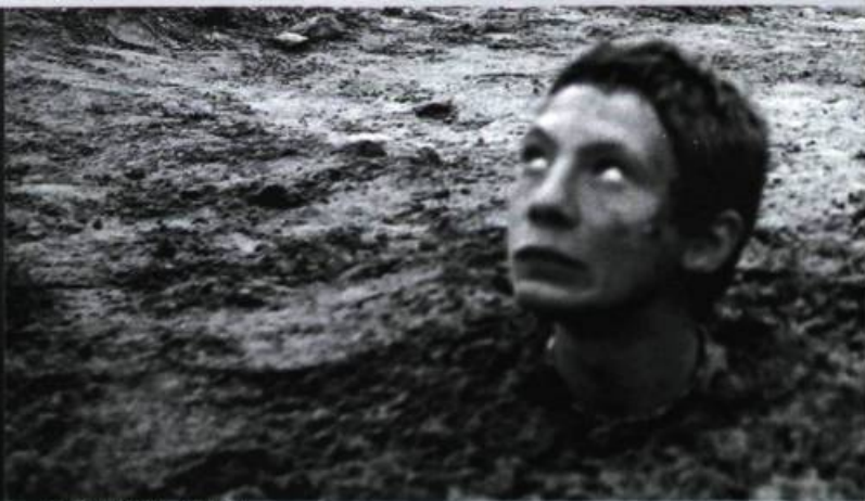
Antychryst d'Adam Guzinski