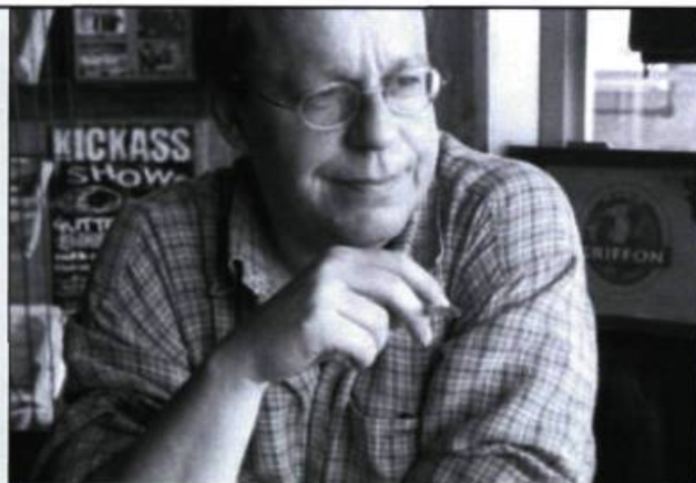
La démocratie, c'est avant tout le droit de discuter et d'interroger l'histoire