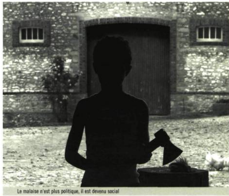
Le malaise n'est plus politique, il est devenu social

Lorsque la guerre froide a mené les scénaristes sur la voie de la panique et des complots où un citoyen au-dessus de tout soupçon était lâché dans des chasses à l'homme ou des accusations erronées, c'était l'État qui tenait l'individu dans