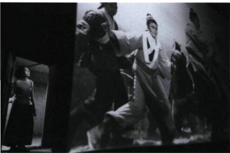
Tsai louange ici l'expérience spectatorielle

Pour certains, Tsai Ming-liang représente la crème du cinéma exigeant, un géant de seulement 48 ans à l'avant-garde de cette génération d'auteurs au large de l'industrie occidentale ayant importé un peu de cinéphilie européenne à l'intérieur de leurs propres frontières, sinon un fort bagage philosophique et esthétique de leurs années de formation ou de perfectionnement à Paris, Londres ou Bruxelles. Pour tous les autres, sûrement encore assommés par le minimalisme de Rebels of the Neon God ou The Hole , le Malais d'origine exaspère, incarnant tous les revers d'un certain cinéma d'auteur indolent qui se complairait dans son aridité dramatique et ses plans lymphatiques. On