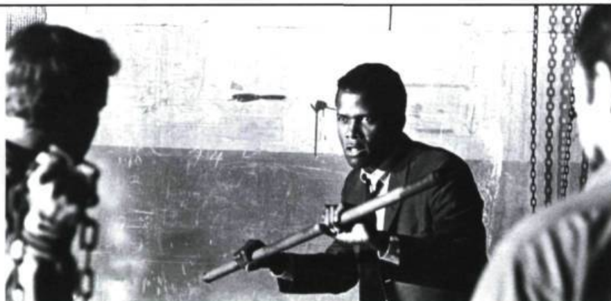
Une scène du film In the Heat of the Night , gagnant d'un Oscar et l'un des plus grands succès de Norman Jewison, tourné en 1967.

« On n'empêchera jamais le cinéma de se transformer. Le cinéma est devenu la littérature de la nouvelle génération. Les concepts visuels sont beaucoup plus importants qu'ils ne l'étaient... »