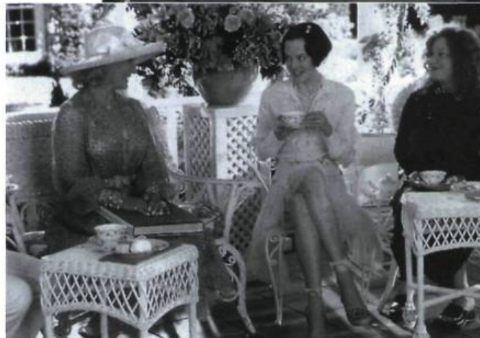
The Stepford Wives

son nouveau caniche mécanique, seins et cerveau reconfigurés. Pendant ce temps, toute impolitesse politique ou subtilité a déserté la ville, laissant le spectateur perplexe devant tant de badinage obsolète sur une impossible conclusion de la bataille des sexes. Pendant que nous fantasmons toujours sur ce qu'auraient pu produire Tim Burton ou Roman Polanski avec une telle prémisse, sachez que le meilleur remake de la fantaisie de 1975 fut sorti dix ans plus tard sous le nom de The Witches of Eastwick .