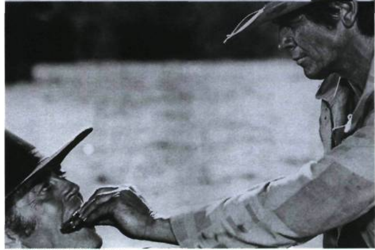
Il était une fois dans l'Ouest

jours différé. Le scénario est, volontiers, d'une confondante débilite dans le style rigoureusement impersonnel de la série Trinita. Leone oppose un héros de western de pacotille — qui n'est qu'un kid , un grand enfant dont le dénuement à lui seul fait rire, qui se livre à un exercice insupportable de cabotinage — à son modèle d'origine, un héros fatigué, au bord de la rupture d'anévrisme, avec comme prétexte une splendide histoire d'escroquerie d'une mine aurifère abandonnée, tributaire du transport d'explosifs par une bande de hors-la-loi, la fameuse horde sauvage, en guise de clin d'œil à Sam Peckinpah.