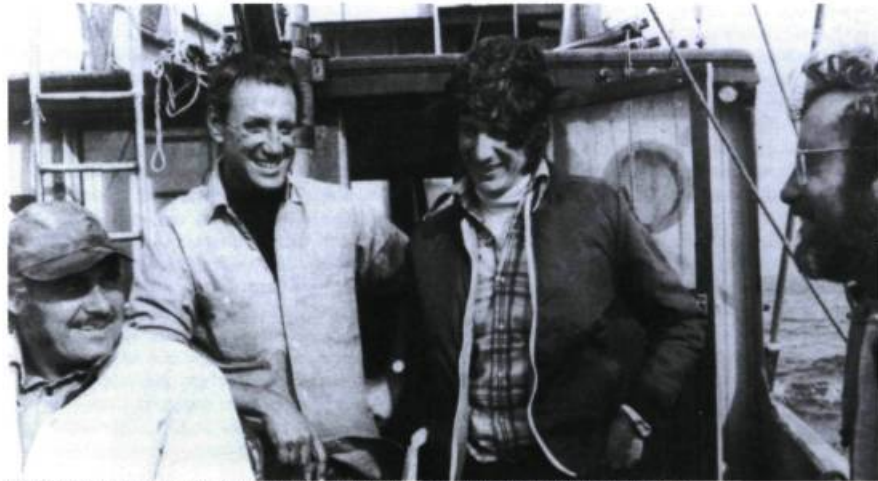
Robert Shaw, Roy Scheider, Steven Spielberg et Richard Dreyfuss sur le tournage de Jaws .

« Quand je serai grand, je voudrai encore être un cinéaste. » – Steven Spielberg