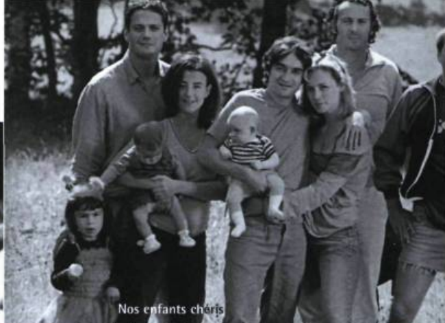
Nos enfants chéris