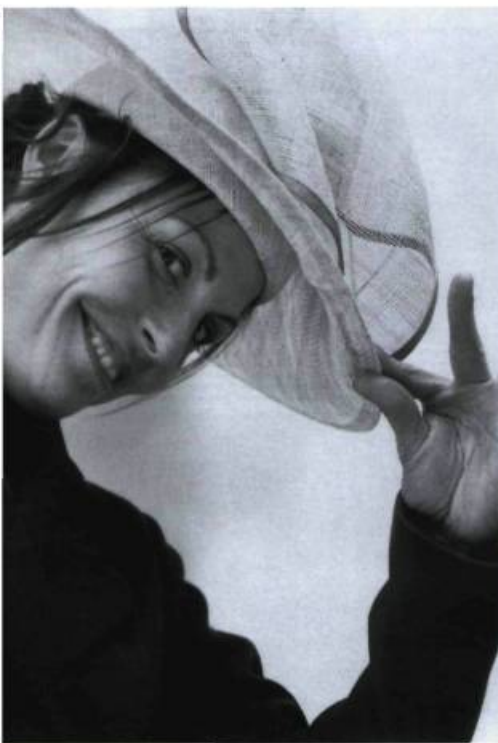
L'Incomparable Mademoiselle C.