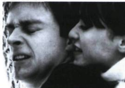
La Peau blanche