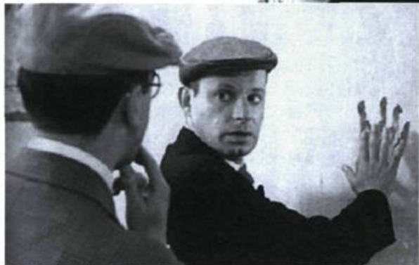
Le Mystère de la chambre jaune