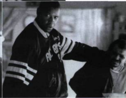
Man on Fire