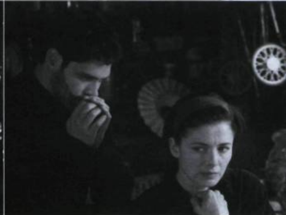
The Day After Tomorrow