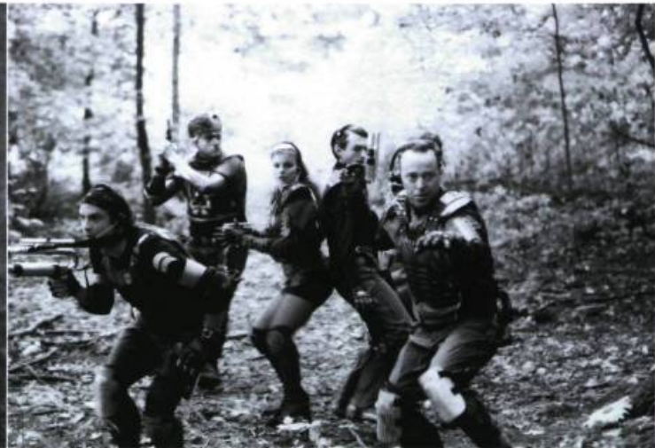
Dans une galaxie près de chez vous