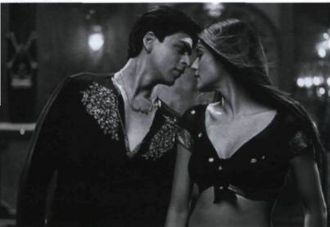
Main Hoon Na