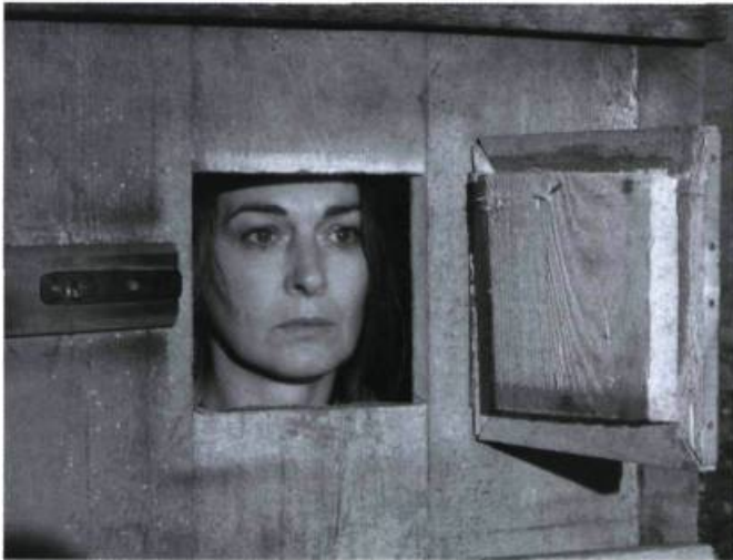
Bénie sois-tu, prison