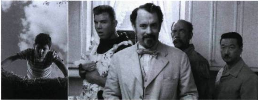
Je n'ai pas peur