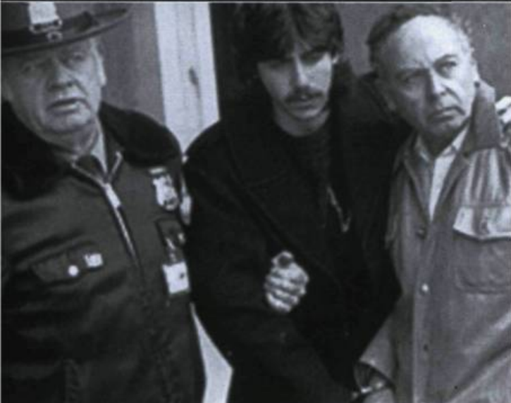
Capturing The Friedmans