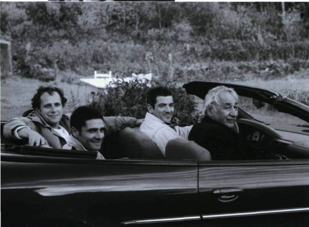
Pères et Fils