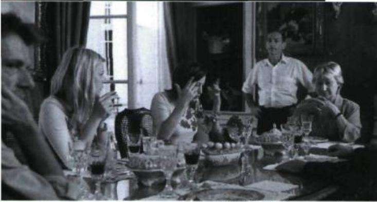
Il est plus facile pour un chameau...