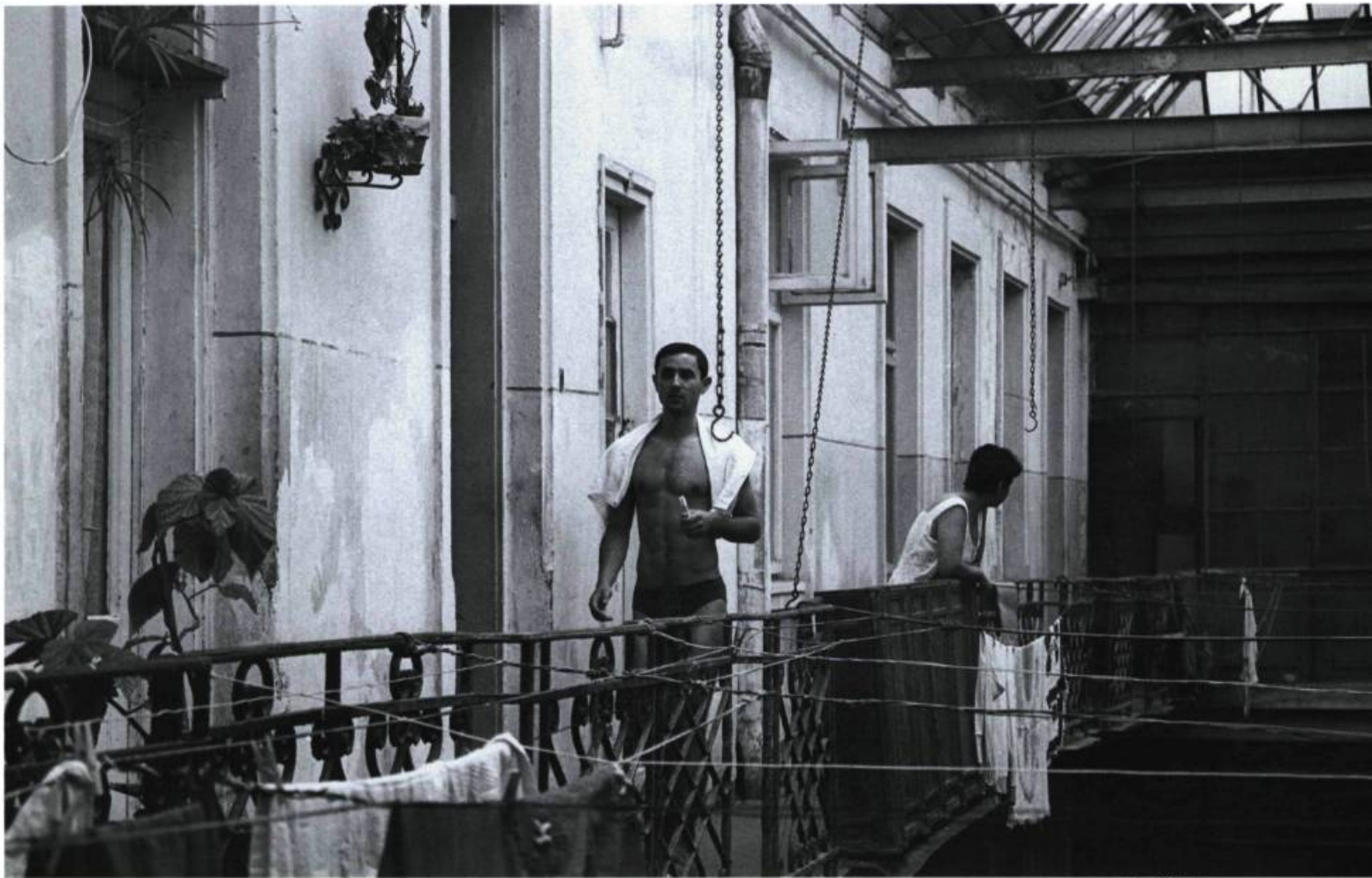
The Wild Dogs

côté de The Matrix , dont l'ombre et l'influence planent encore sur les productions du genre. De quoi ravir les fans inconditionnels de ce type de divertissement.