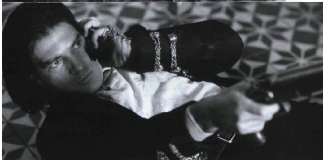
Once Upon a Time in Mexico