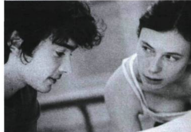
Le Chignon d'Olga

comédiens. Si Jean-Pierre Darroussin et Gérard Darmon incarnent toujours avec justesse des mêmes rôles-types, Bernard Campan et le chanteur Marc Lavoine s'avèrent les surprises du film. Révélé l'an dernier pour son étonnante performance dramatique dans le film Se souvenir des belles choses de Zabou Breitman, Campan campe à merveille le personnage le plus émouvant et le plus étoffé du film, celui d'Antoine, qui quitte la femme qu'il aime après que cette dernière lui avoue une aventure récente. Quant à Lavoine, il est parfait en macho de service.