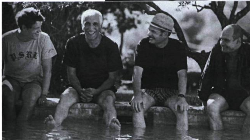
Le Cœur des hommes