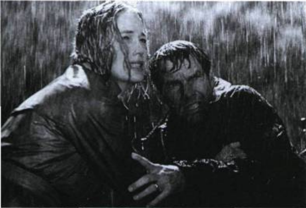
Cold Creek Manor