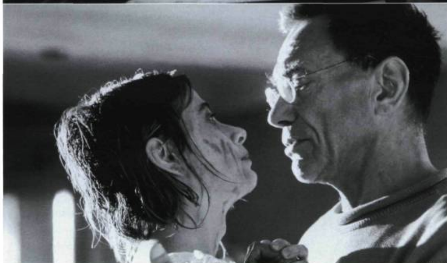
House of Fools

d'un asile psychiatrique situé tout prêt de la frontière avec la Tchétchénie. La guerre est à la porte, frappe à la porte, franchit les portes, s'installe quelque temps au milieu de ces hommes et de ses femmes qui se sont depuis longtemps fabriqué un autre petit monde doté de ses propres règles. Le mot même d'invasisseur ne fait pas partie de leur vocabulaire. Puis la guerre s'en va, revenant par à-coups, le temps de provoquer quelques secousses parmi les locataires ébahis du bâtiment.