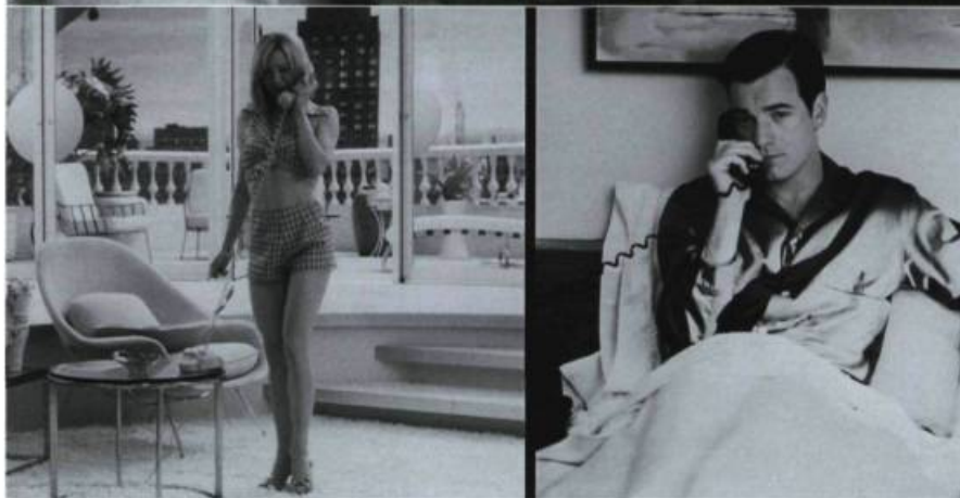
Down with Love