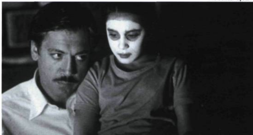
The Dancer Upstairs

États-Unis/Espagne 2002, 128 minutes — Réal. : John Malkovich — Scén. : Nicholas Shakespeare, d'après son roman — Int. : Javier Bardem, Laura Morante, Juan Diego Botto, Elvira Minguez, Alexandra Lencastre, Oliver Cotton — Dist. : Fox.