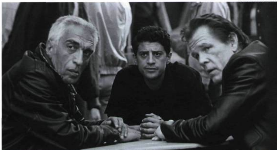
The Good Thief

Après Sibériade (1979) qui l'avait fait connaître grâce à sa sélection au Festival de Cannes, le frère aîné de Nikita Mikhalkov était allé tourner quelques films américains dont les inoubliables Maria's Lovers (1984), Runaway Train (1985) et Shy People (1987). Aujourd'hui, Andreï Konchalovsky est rentré réaliser ses films en Russie. House of Fools (ou La Maison de fous , puisqu'il s'agit d'une coproduction avec la France) nous arrive par hasard et c'est un hasard que nous accueillons avec énormément de plaisir. Dans cette fable qu'il a lui-même écrite, il nous raconte les tribulations d'un groupe de patients