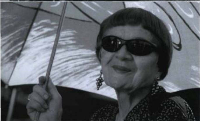
Un toit, un violon, la lune

Dire que Stevie est un film glauque est un euphémisme. À travers le portrait sans fard de la tragédie d'un être, l'incompétence parentale est pointée, certes, mais aussi l'échec du village qui assiste impuissant à cette noyade. Plus encore, le tableau dépeint est celui de la décrépitude morale de toute l'Amérique rurale qui ne fait jamais qu'empirer la situation à laquelle elle tente de remédier. En cela, le film de James est la chronique prévisible, shakespearienne d'un destin inéluctable, justement an accident waiting to happen .