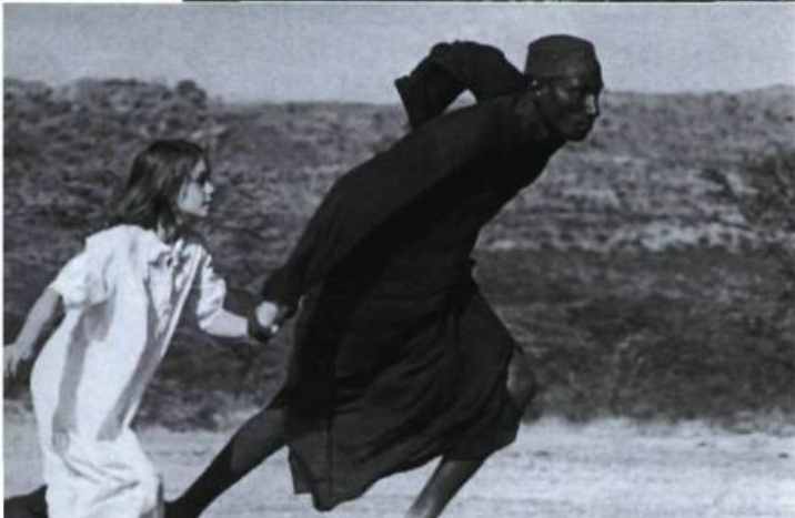
Nowhere in Africa

Reeves, Laurence Fishburne, Carrie-Anne Moss, Hugo Weaving, Jada Pinkett Smith, Monica Bellucci. — Dist. : Warner.