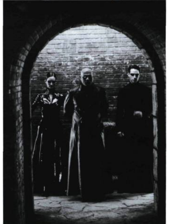
The Matrix Reloaded

Dans ce deuxième chapitre de la trilogie, The Matrix Reloaded (dont la suite The Matrix Revolutions est prévue pour le 5 novembre prochain) Keanu Reeves, Laurence Fishburne et Carrie-Anne Moss reprennent tous trois leurs rôles respectifs de Neo, Morpheus et Trinity. Avec l'armée