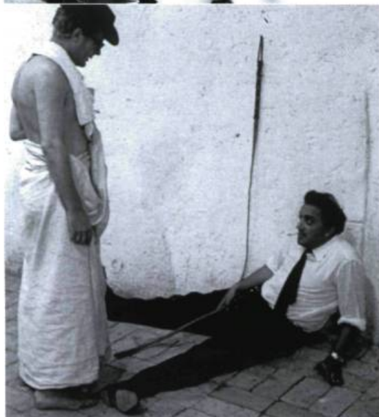
Fellini, je suis un grand menteur

Cette œuvre très révélatrice d'une problématique rurale désespérante frappe, à l'instar de son titre, par le ton franc et direct imposé dès l'ouverture. À la caméra, chacun se livre, se dévoile avec grande générosité et authenticité, preuve incontestée du climat de confiance que Synnott établit avec ses sujets. D'ailleurs, leurs nombreux messages laissés sur le répondeur de « la fille qui fait le film » qu'on entend en liens narratifs confirment le rapport de familiarité développé au cours du tournage. L'homosexualité, l'éloignement forcé, l'anorexie, le vide amoureux, la difficulté à trouver sa place et le rapport souvent houleux entre générations sont autant de thèmes abordés dans ce film que de difficultés vécues par toute cette génération sacrifiée. L'un des moments forts reste sans nul doute celui où fils, mère et grand-mère parlent à cœur découvert d'homosexualité comme jamais ils n'ont osé le faire auparavant. En plus des images fortes et magnifiques des paysages gaspésiens, il faut aussi mentionner la poésie brute de la narration quand la voix particulière de Nathalie Synnott livre à son tour des pans de sa vie et de ses épreuves.