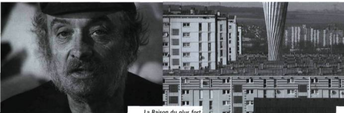
La Raison du plus fort