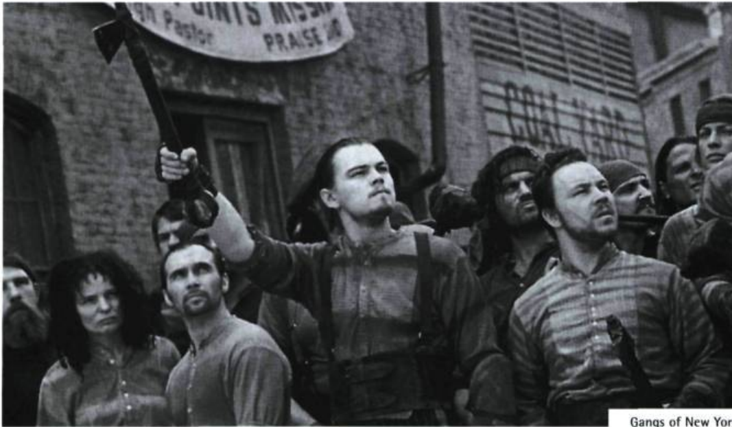
Gangs of New York

musique. Comme si je faisais jouer du Beethoven ou du Mozart. Vous ne dites pas : "J'ai entendu la Cinquième Symphonie de Beethoven, je ne l'écouterai plus jamais." ».