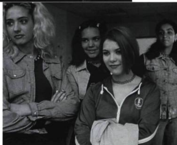
Les Autres Filles

Loin des prétentions didactiques de Breillat concernant « la violence de la tra-