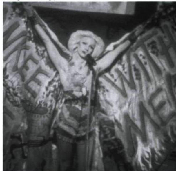
Hedwig and the Angry Inch