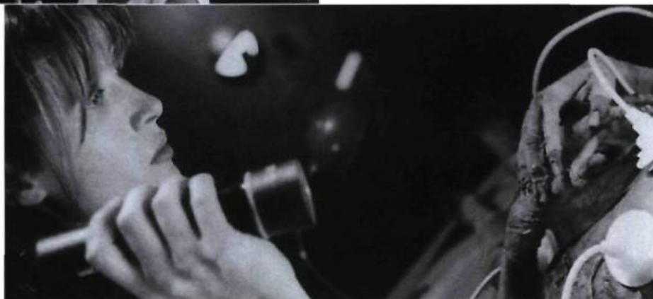
Belphégor, le fantôme du Louvre