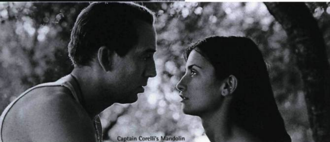
Captain Corelli's Mandolin

joué une mélodie à la mandoline en son nom. Ensuite, le film traîne en longueur dans la première partie, malgré les décors naturels et magnifiques de la merveilleuse île grecque. Même si le rythme change considérablement en seconde moitié et que les scènes d'action et de guerre sont menées avec doigté, l'émotion ne passe guère. Ces moments dramatiques sont tellement encombrés d'éléments fortuits et de rebondissements peu plausibles que la crédibilité du film en souffre. De plus, un épilogue inutile et un happy end inévitable mais néanmoins incongru viennent miner davantage ce projet ambitieux au résultat malheureux. Nicolas Cage, capable du meilleur comme du pire, est peu convaincant, alors que la belle Penélope Cruz parvient à communiquer ses sentiments à défaut d'une réelle passion.