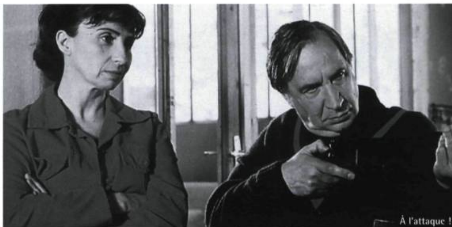
À l'attaque !