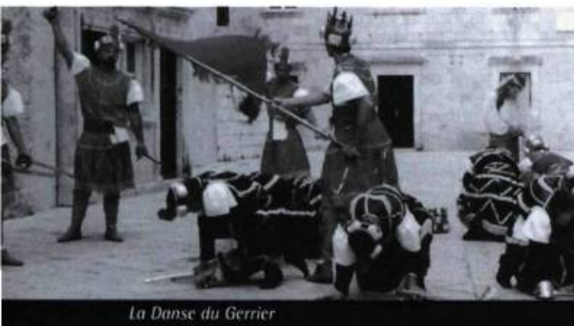
La Danse du Guerrier

Canada [Québec] 2001, 52 minutes — Réal. : Marie Brodeur — Scén. : Marie Brodeur — Avec : Sid'Ali, Louis Nikopoulos, Nicholas Arhontu, Oumar N'Diyae, Mohammed N'Diyae — Dist. : Office national du film du Canada.