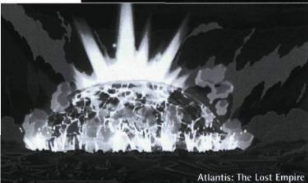
Atlantis: The Lost Empire