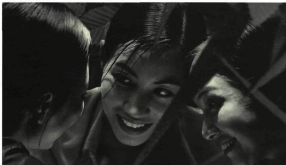
À la verticale de l'été

Une formidable émotion et un indescriptible monde de sensations, surtout, exsudent de la dernière œuvre du cinéaste. Attentif aux gestes quotidiens, celui-ci peaufine sa mise en scène avec un tel doigté qu'il donne l'impression d'immobiliser le temps, de rendre palpable l'immatériel. La caméra s'attarde aux moindres vacillements des regards féminins, aux volutes des plats fumants, à l'eau qui tombe à verse, frémit, ruisselle ou bouillonne... Elle enregistre, en creux, tout ce qui semble appartenir au domaine de l'invisible et de l'indicible. Ce n'est alors qu'au hasard de gros plans somptueux, de longs plans-séquences quasi silencieux mais combien évocateurs, d'éclairages subtils, de jeux d'ombres et de transparences raffinés, de scènes quotidiennes itératives, ainsi que de décors et de costumes ma-