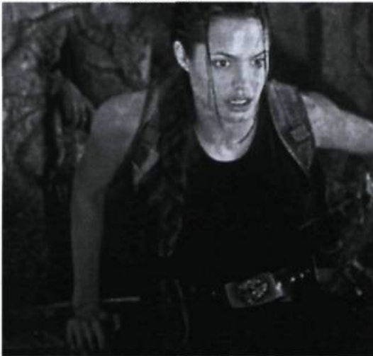
Lara Croft: Tomb Raider

bouche légèrement entrouverte et lèvre inférieure pendante).