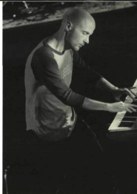
All access: Front Row. Backstage Live!

Ils sont populaires, riches et n'ont pas de boutons. Ils n'ont rien à dire, mais ils parlent quand même. Sting, Sheryl Crow, Carlos Santana et quelques autres sont les protagonistes de All access: Front Row. Backstage Live! , le nouveau vidéoclip IMAX. En assistant, à partir de l'arrière-scène, aux tests de son précédant les spectacles des gros noms de la pop actuelle, nous pénétrons une intimité préfabriquée. Les situations intimes sont, évidemment,