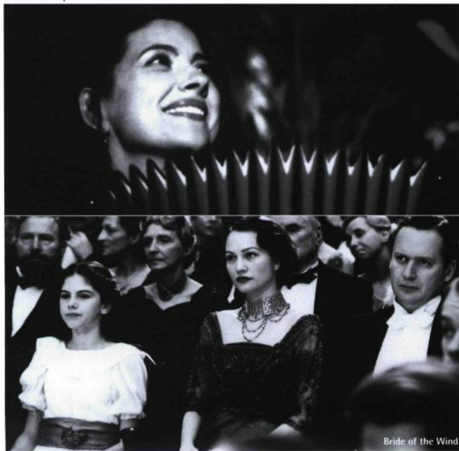
Bread and Tulips