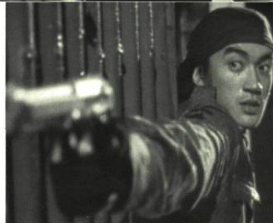
Time and Tide

Également, il a réussi à faire découvrir à l'Occident toute la magie du cinéma fantastique de Hong-Kong avec, notamment, Zu: Warriors from the Magic Mountain (Shu shan) et Histoires de fantômes chinois (Sinnui yauman) . Technicien hors pair, il a fait étalage de tout son talent dans Time and Tide , un thriller survolté et bourré d'action qui décoiffe comme pas un. La caméra, vertigineuse se déplace dans tous les sens, le montage est d'une fluidité étonnamment remarquable pour ce genre de film et les morceaux de bravoure s'enchaî-