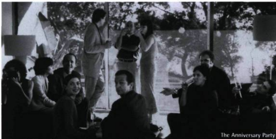
The Anniversary Party