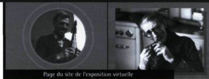
Page du site de l'exposition virtuelle

De Nanouk à l'Oumigmag, le cinéma documentaire au Canada