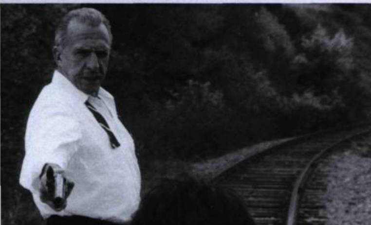
Monsieur Monsieur, de Stefan Miljević

Pour la deuxième année consécutive, l'organisme montréalais de cinéma indépendant Main Film nous offre Courts toujours, sa série de rendez-vous mensuels avec les courts métrages. Les deux premiers de cette année, tenus en février et en mars, avaient pour thèmes « Rumeur sur la ville » et « Contes moraux ».