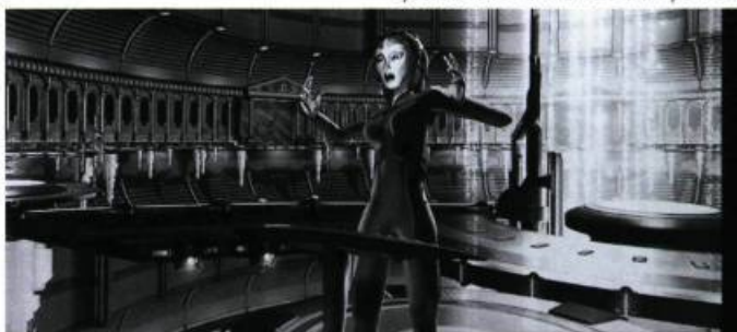
Cyberworld | À la manière d'un portfolio