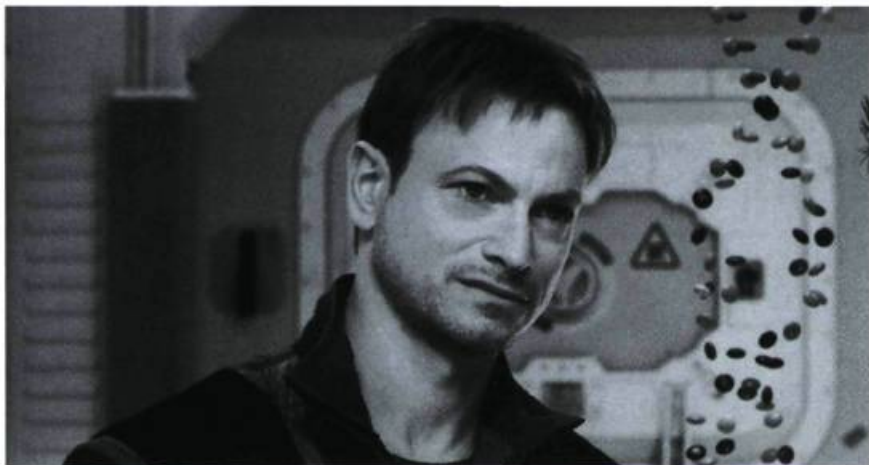
Un héros typiquement américain

Si l'on exclut les raisons commerciales évidentes (salaire colossal, budget considérable, moyens techniques imposants), on pourrait croire que Brian De Palma a voulu envoyer les héros de ses