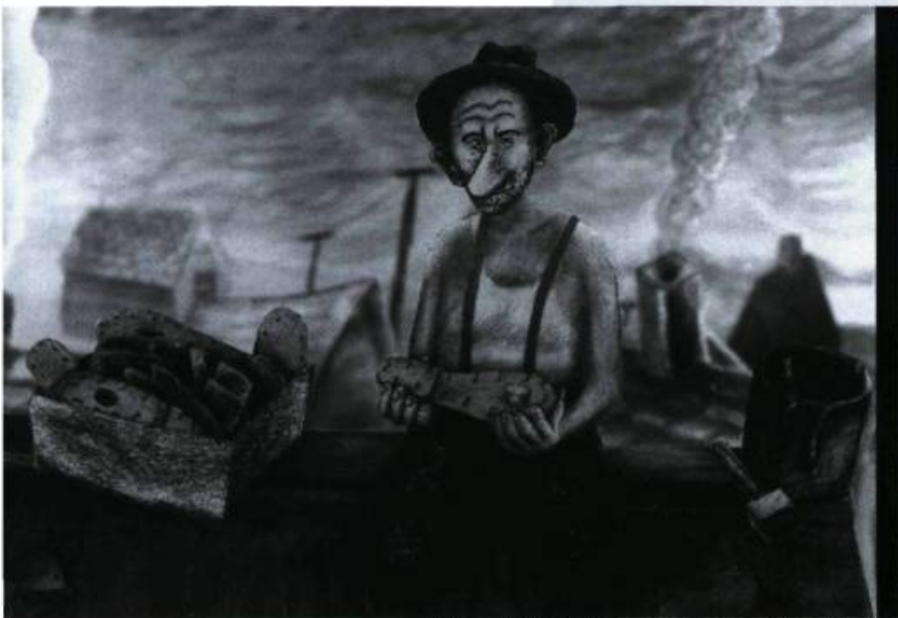
Village of Idiots , d'Eugene Fedorenko et Rose Newlove

Main Film, organisme de production et de diffusion de cinéma indépendant, a décidé, cette année, pour faciliter la diffusion des courts métrages canadiens, d'organiser à chaque dernière fin de semaine du mois une présentation de courts métrages au Goethe Institut de Montréal. En janvier 2000, le premier programme comptait quelques films et vidéos humoristiques. Dans Bonbons bijoux (1996), Sylvie Laliberté témoignait déjà de son