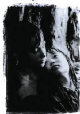
Snow Falling on Cedars