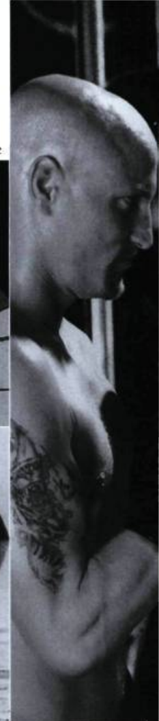
Play It to the Bone