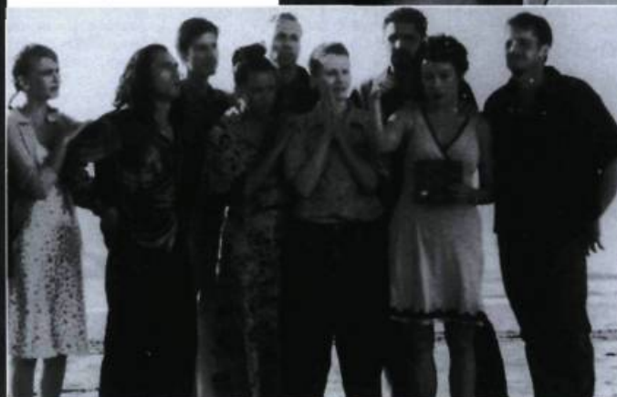
Relax... It's Just Sex !