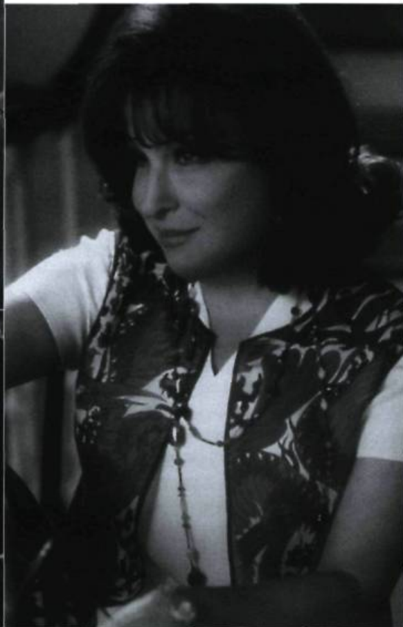
Isn't She Great