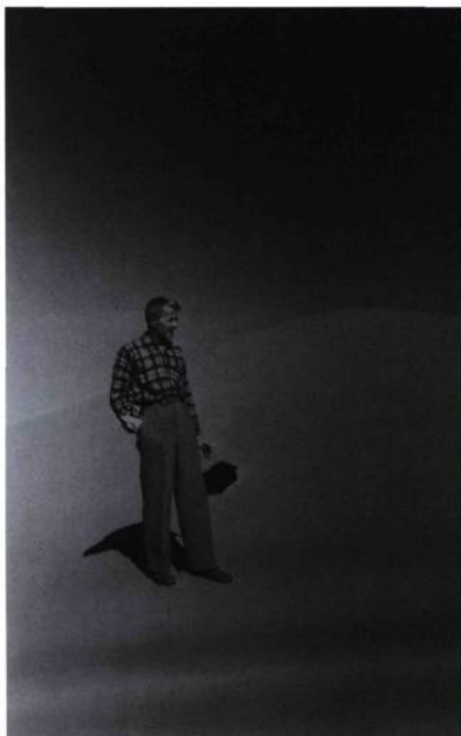
Let It Come Down: The Life of Paul Bowles