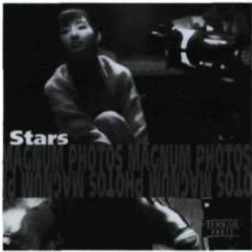
Films Stars. Photographs of Magnum Photos/Photographies de Magnum Photos Fotografien von Magnum Photos Collectif Paris, Éditions Pierre Terrail, 1998 64 pages