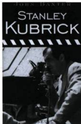
Stanley Kubrick John Baxter Paris, Éditions du Seuil, 1999 407 pages

Ce livre se signale par une grande attention portée aux détails pour tenter d'expliquer l'œuvre de Kubrick à travers la vie de celui-ci. Par exemple, Baxter accorde une grande place