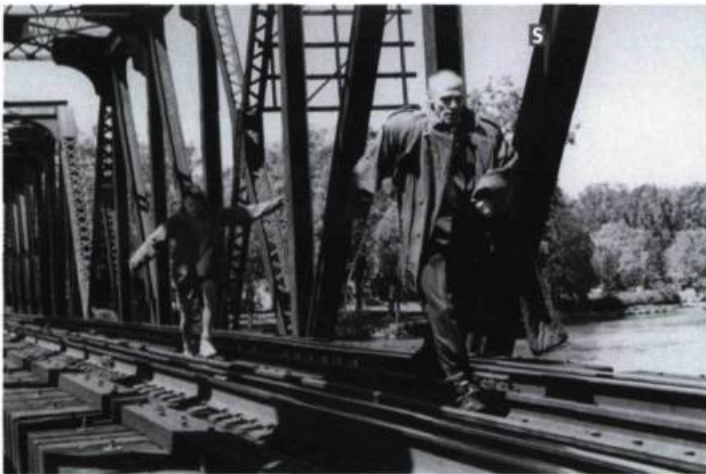
Le très symbolique Écho d'un dernier matin

La maison de distribution montréalaise Funfilm distribue habituellement des longs métrages comme Elizabeth , de Shekhar Kapur, What Dreams May Come , de Vincent Ward, et Return to Paradise , de Joseph Ruben. Cette année, exceptionnellement, quelques cinéastes ont aussi proposé des courts métrages au distributeur