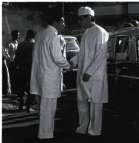
Such a Long Journey

GB/Can. 1998, 102 min. — Réal.: Vadim Jean — Int.: Kelsey Grammer, Amanda Donohoe, Geneviève Tessier, Kay Tremblay — Dist.: Behaviour.