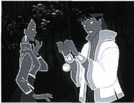
The King and I

pour lui. La Warner a voulu se simplifier la vie en ajoutant de l'animation par ordinateur à l'animation classique. Cela n'est pas sans gâcher le plaisir des yeux avertis, mais ne dérange nullement les petits amateurs tout à fait envoûtés par les beautés du Siam. (LB)