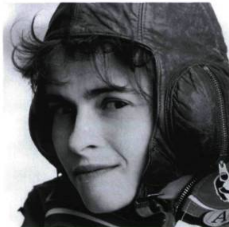
The Theory of Flight