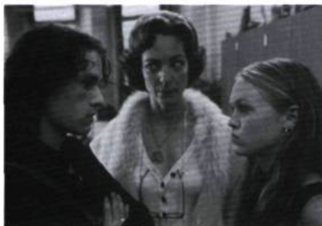
10 Things I Hate About You

Can./GB 1998, 112 min. — Réal.: Sturla Gunnarsson — Int.: Roshan Seth, Soni Razdan, Om Puri, Naseeruddin Shah, Ranjit Chowdhry — Dist.: France Film.