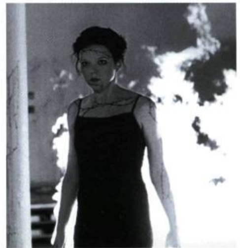
The Rage: Carrie 2

Leilasede — Isr. 1995, 100 min. — Réal.: Shemi Zarhin — Int.: Gila Almagor, Yossef Shiloah, Miki Kam, Aryeh Moskona — Dist.: Del Fuego.