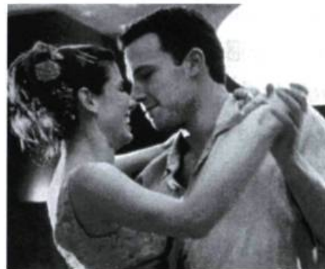
Forces of Nature

Après l'institution de la famille, c'est celle du mariage qu'on remet ici en question. Rien de nouveau à l'horizon pour un tel questionnement que l'individu se pose depuis des siècles. Reste cependant une interprétation attachante de Sandra Bullock, parfaite pour ce genre de rôle, et de Ben Affleck qui, hors du circuit indépendant, s'emploie à embraser les regards ébahis de nombreuses spectatrices (et de certains spectateurs!). La finale, d'une rectitude politique à laisser