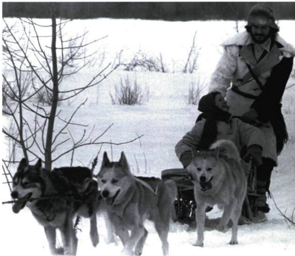
Quelques arpents de neige