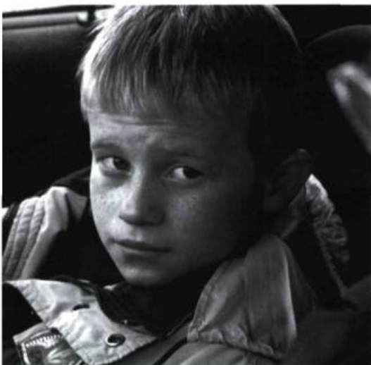
L'Éternité et un jour

emprisonnement dans un environnement pris dans la tourmente. Et la terre, présente, rude, orgueilleuse et indifférente à l'égard de ceux qu'elle abrite.