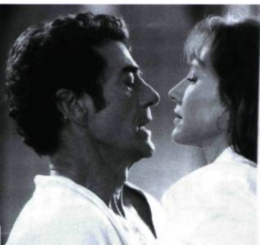
Si je t'aime, prends garde à toi